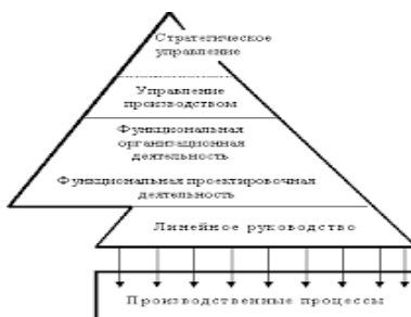
Рисунок 1. Название рисунка